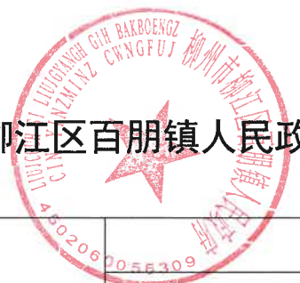
柳州市柳江区百朋镇人民政府 2024 年度行政征收实施情况统计表