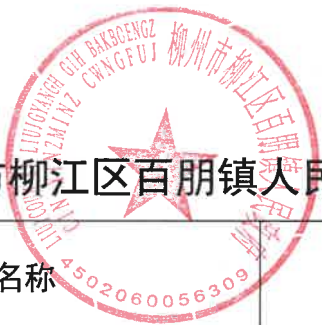
柳州市柳江区百朋镇人民政府 2024 年度行政确认实施情况统计表